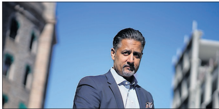
PENGER: Kulturminister Abid Q. Raja (V) sender mesteparten av pengene øremerket til mediehusene tilbake i statskassen.