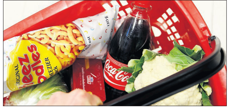
FORSKJELLER: Norske dagligvare opplever store forskjeller i innkjøpspriser.

Det er de samme 16 leverandørene som er undersøkt, og tilsynet følger opp samtlige for å finne ut mer om årsaker til forskjellene.