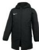
Team Park 20 Winter Jacket Klubbpris jr 999,- / sr 1079,-