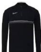
Academy 21 halv zip Klubbpris jr 319,- / sr 359,-