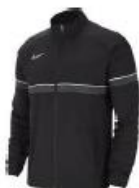
Academy 21 woven track (vind) Klubbpris jr 319,- / sr 359,-