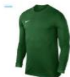
Park l/s Klubbpris jr 183,- / sr 215,-