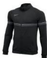
Academy 21 Track Jacket Klubbpris jr 319,- / sr 359,-