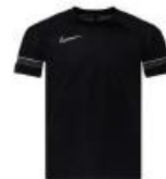
Academy 21 trøye Klubbpris jr 135,- / sr 183,-